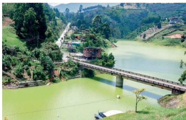
Figura 02. Embalse de Guatapé, problemáticas ambientales.

de recursos energéticos e hídricos, para eficiencia sustentable del proyecto.