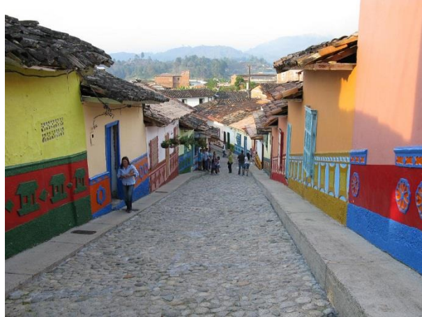
Figura 03. Guatapé Pueblo de Zócalos.

Los criterios de diseño surgen de determinantes del lote, como topografía, asoleación y vientos, tomando en cuenta sus condicionantes climáticas, complementado con criterios de eficiencia energética e hídrica, y movilidad espacial inclusiva.