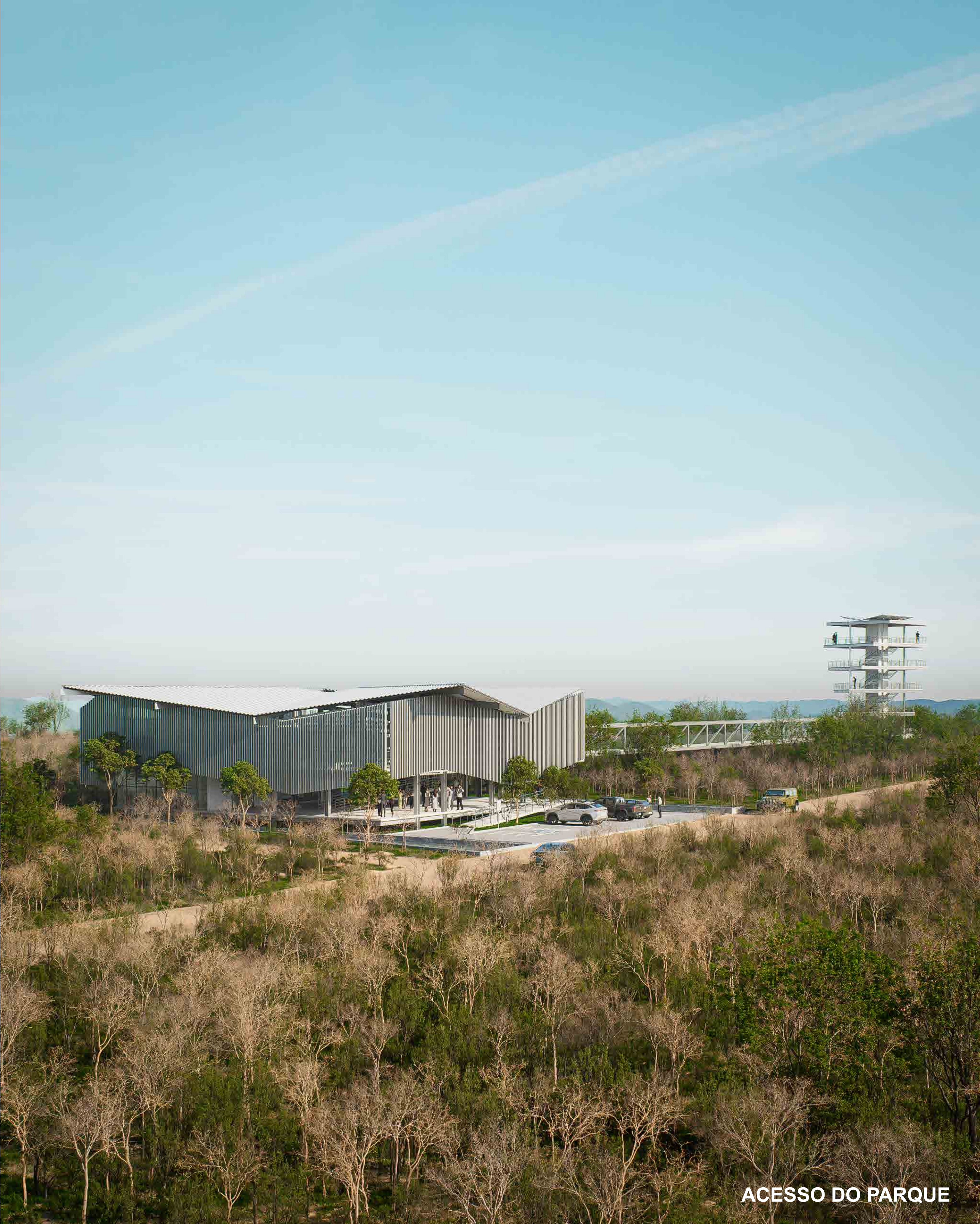
ACESSO DO PARQUE