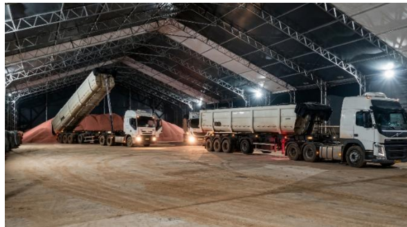
Figura 2 – Exemplo de galpão constituído de pórticos treliçados

Fonte: https://topflexlog.com.br/galpoes-para-graos/