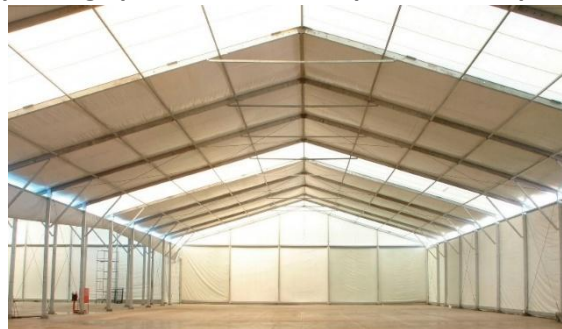
Figura 3 – Exemplo de galpão constituído de pórticos com perfis em alma cheia