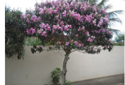
Quaresmeira (Tibouchina Granulosa)

A paisagem urbana sofre com a falta de planejamento em relação à arborização e os estudos no bairro demonstra claramente esse aspecto que tem um impacto direto sobre as condicionantes ambientais e a composição paisagística do local.