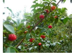
Pitangueira (Eugenia uniflora)