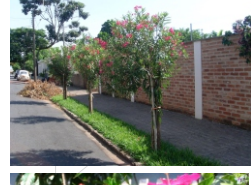
Espirradeira (Nerium Oliander)