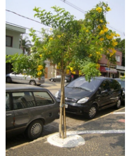
Ipê Mirim (Tecoma Stans)