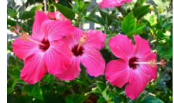
Hibisco (Hibiscus rosa-sinensis)