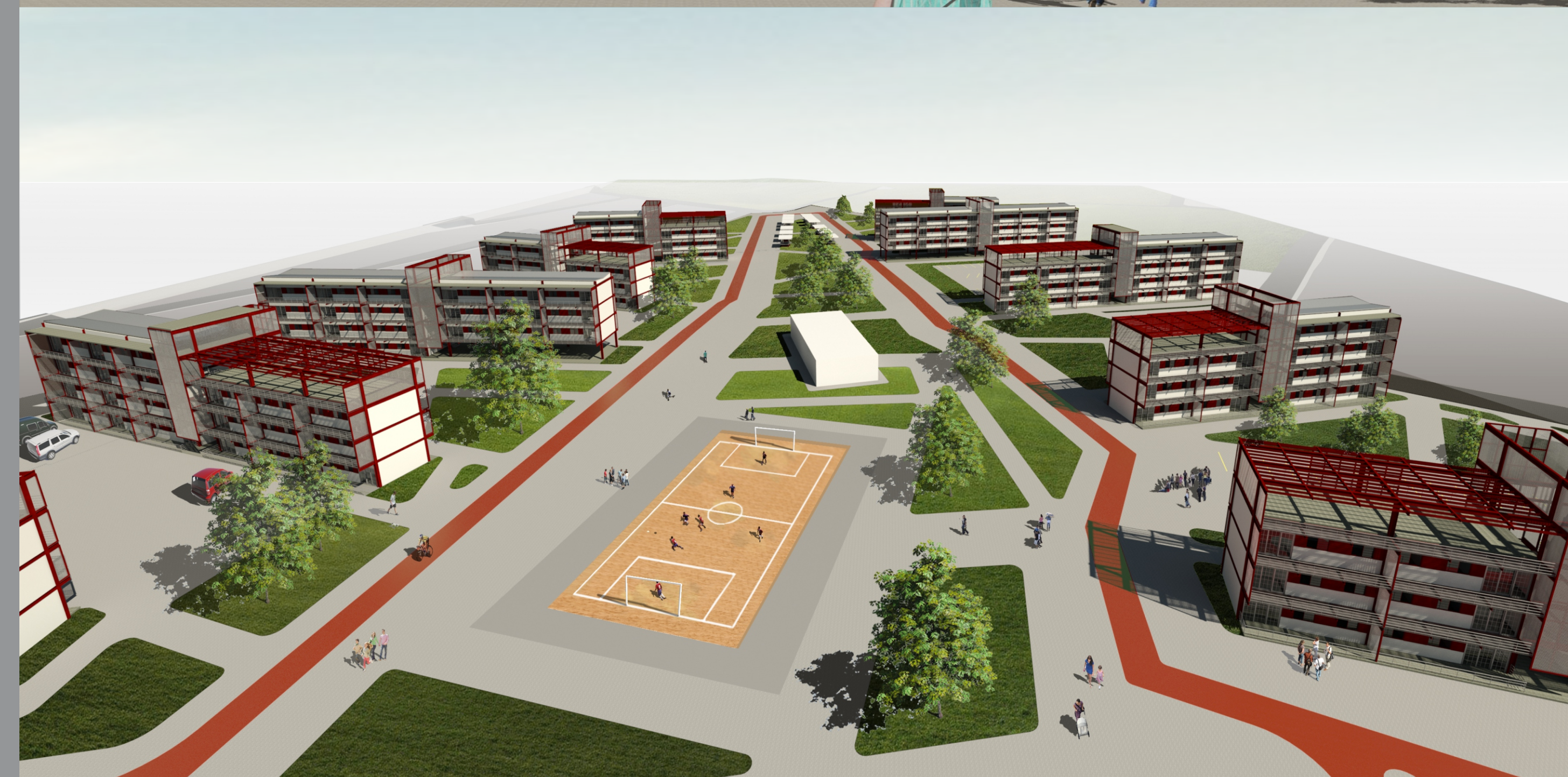
LÁMINA Nº 01