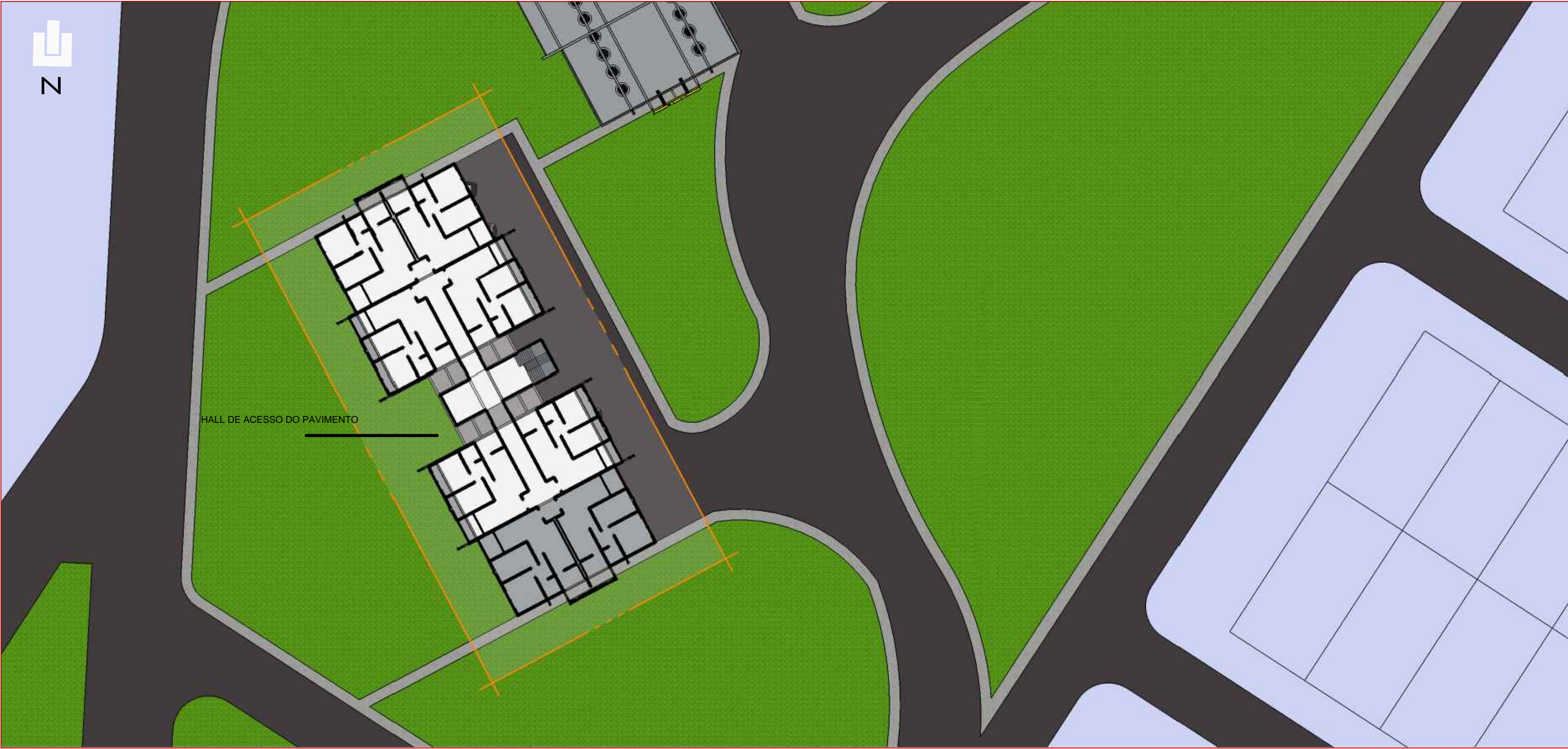
CORTE DO PAVIMENTO DO EDIFÍCIO

As empenas dos edifícios contam com um sistema de armazenamento para águas pluviais com capacidade de seis mil e quinhentos litros cada tendo o edifício uma reserva de treze mil litros de água, embutido entre as vigas de enrijecimento da estrutura e protegido por chapas de aço perfuradas convenientemente para garantir ao mesmo tempo a privacidade e a ventilação das áreas de serviços.