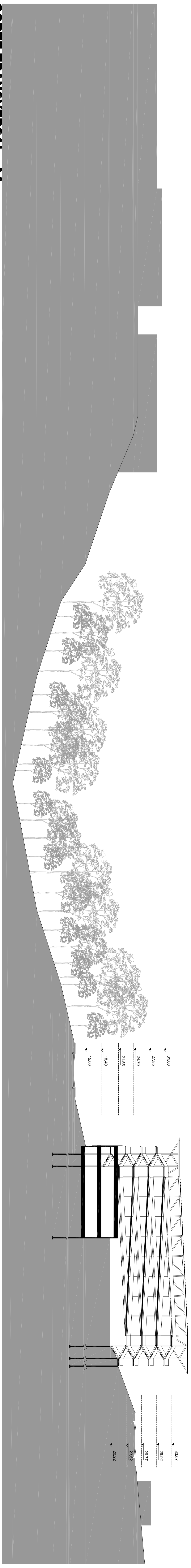
CORTE TRANSVERSAL - AA