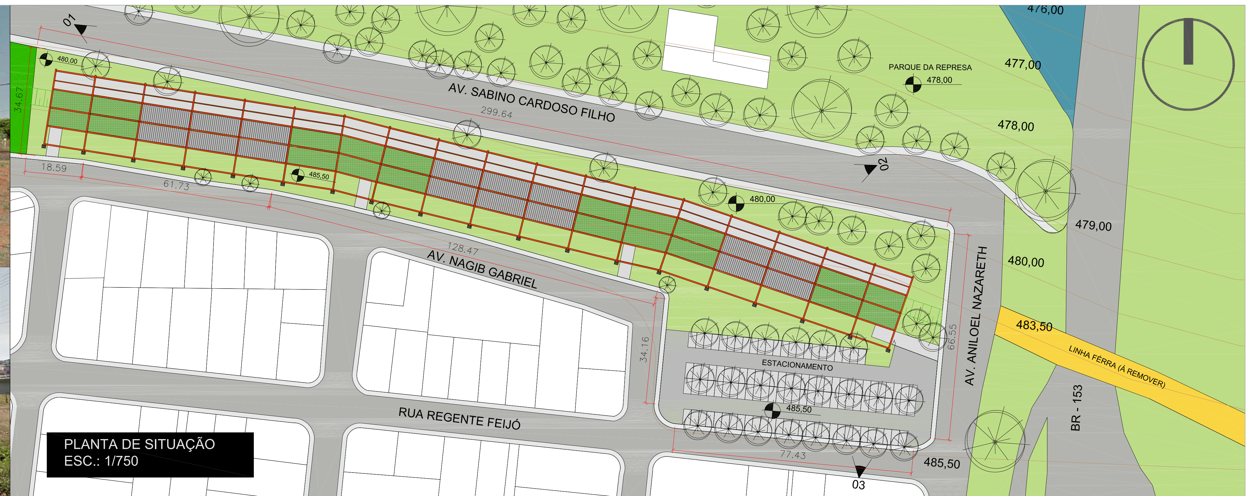
PLANTA DE SITUAÇÃO ESC.: 1/750