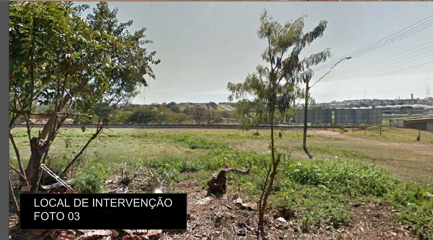
LOCAL DE INTERVENÇÃO FOTO 03