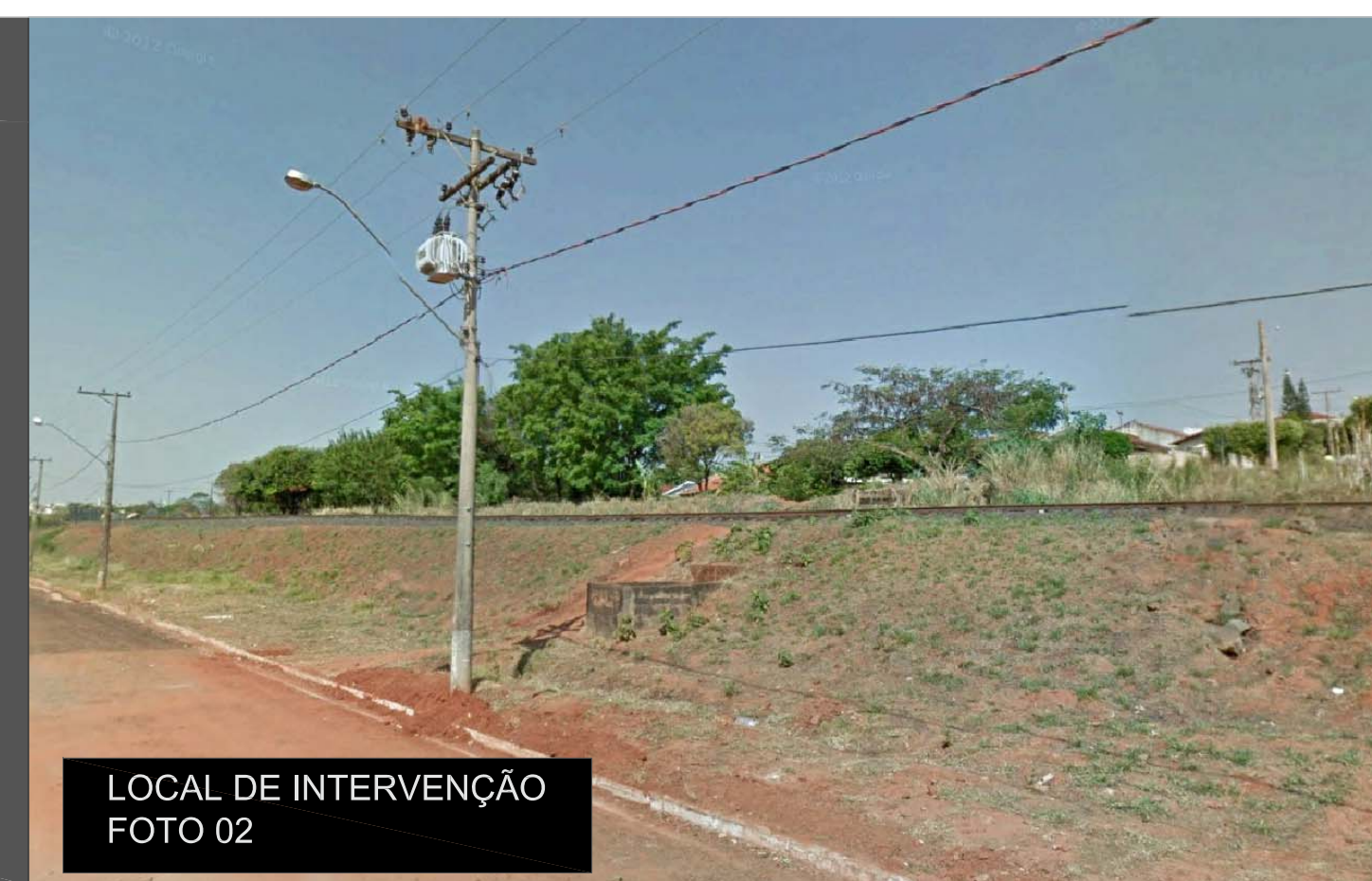
LOCAL DE INTERVENÇÃO FOTO 02

Sendo assim, tirando partido do cenário favorável, a escolha do local pretende revitalizar a área em desuso, permitindo a conexão da população com o parque da represa, como também agregando o caráter social, não só para a habitação em si, mas para a integração dos moradores com a cidade.