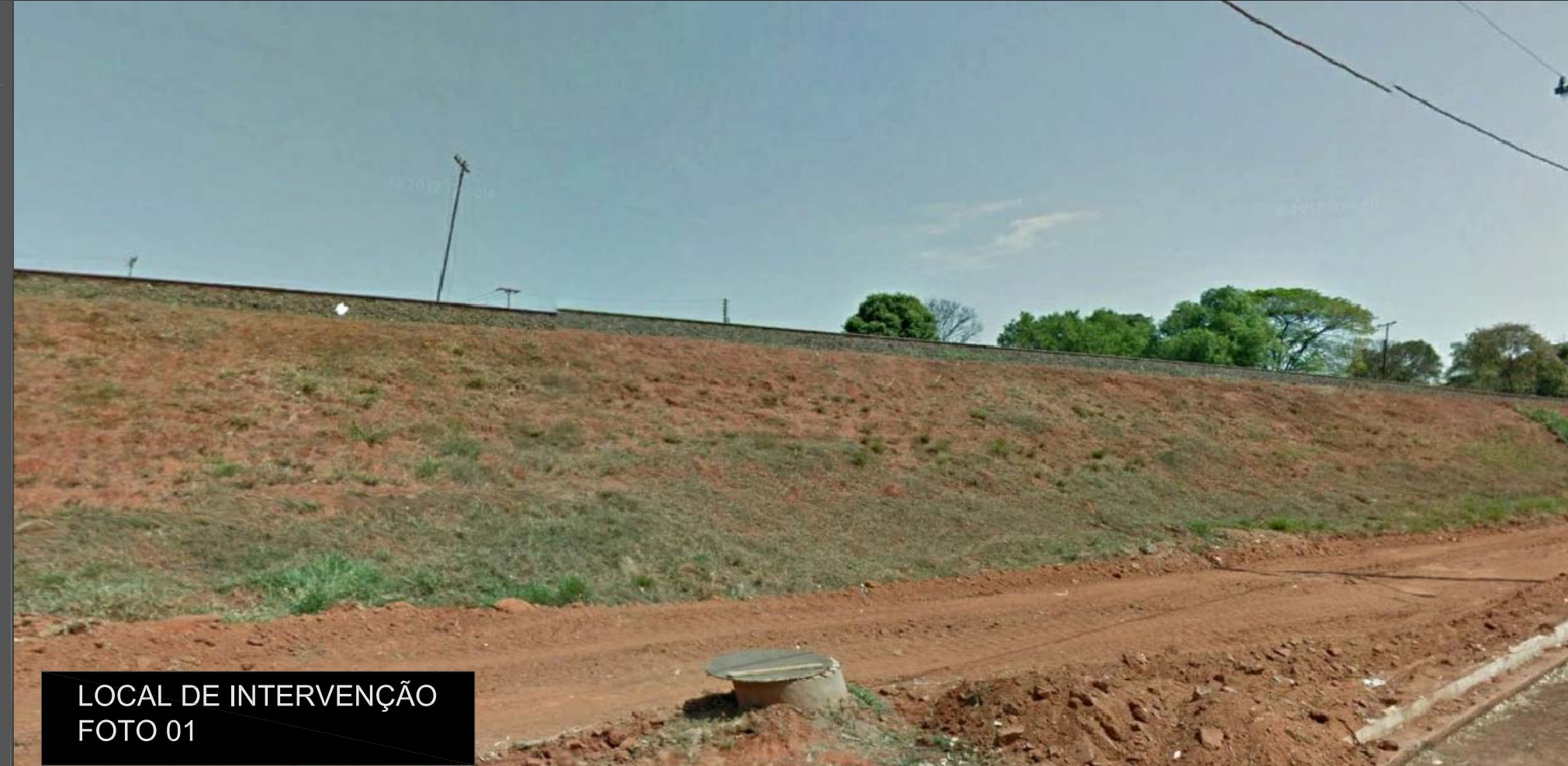
LOCAL DE INTERVENÇÃO FOTO 01

Segundo o censo de 2010, a população residente era de 408.258, (IBGE, 2010); já a estimativa do para 2013 foi de 434.039. (IBGE, 2013). São José do Rio Preto teve um crescimento populacional de 20,85% entre os anos de 1991 a 2000 (IBGE, 2009). Em relação a estimativa de 2013, a cidade teve um aumento de 17,40% comparado aos anos 2000. Contando também com uma densidade demográfica de 945,12 hab/km².