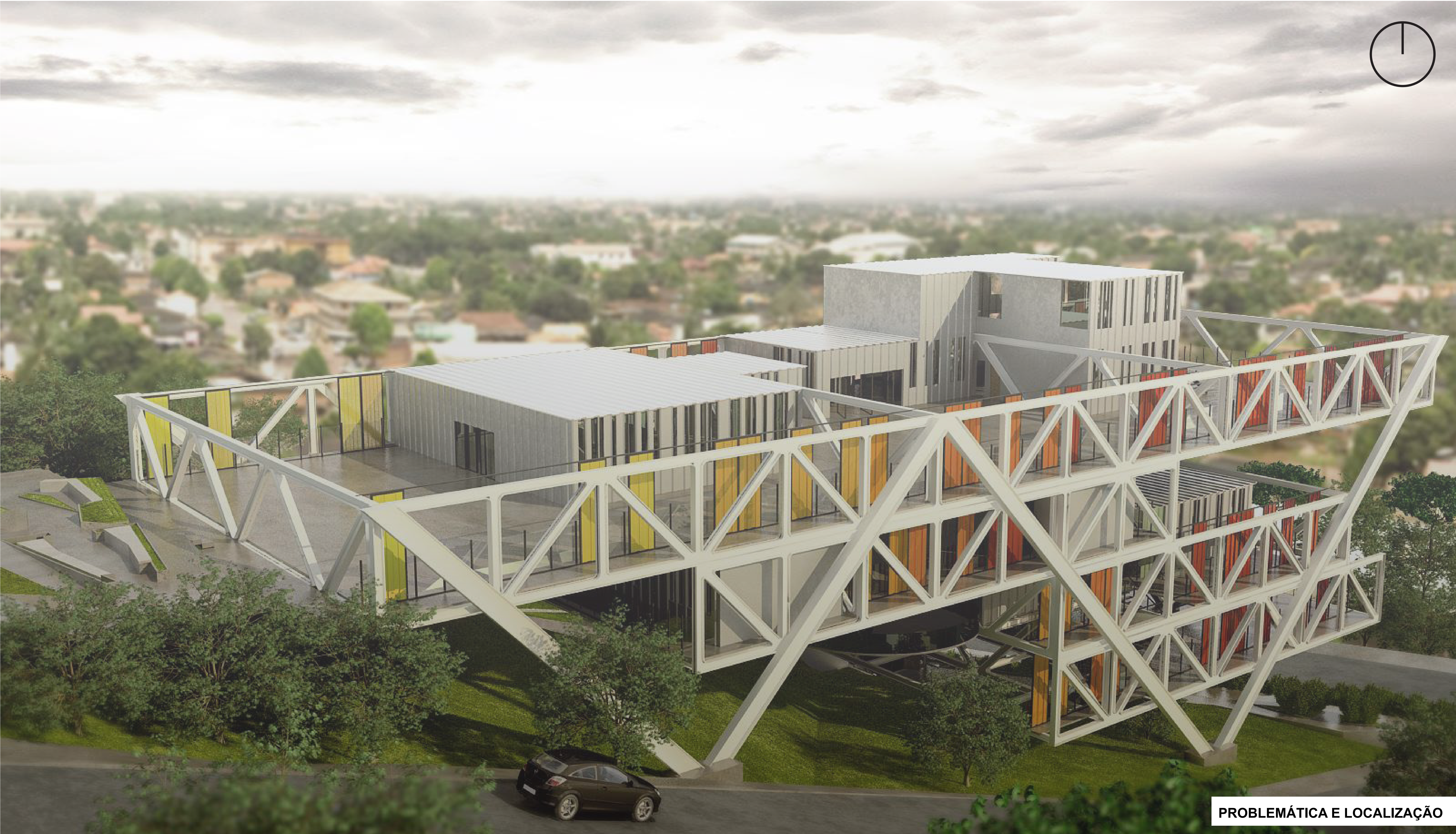
PROBLEMÁTICA E LOCALIZAÇÃO