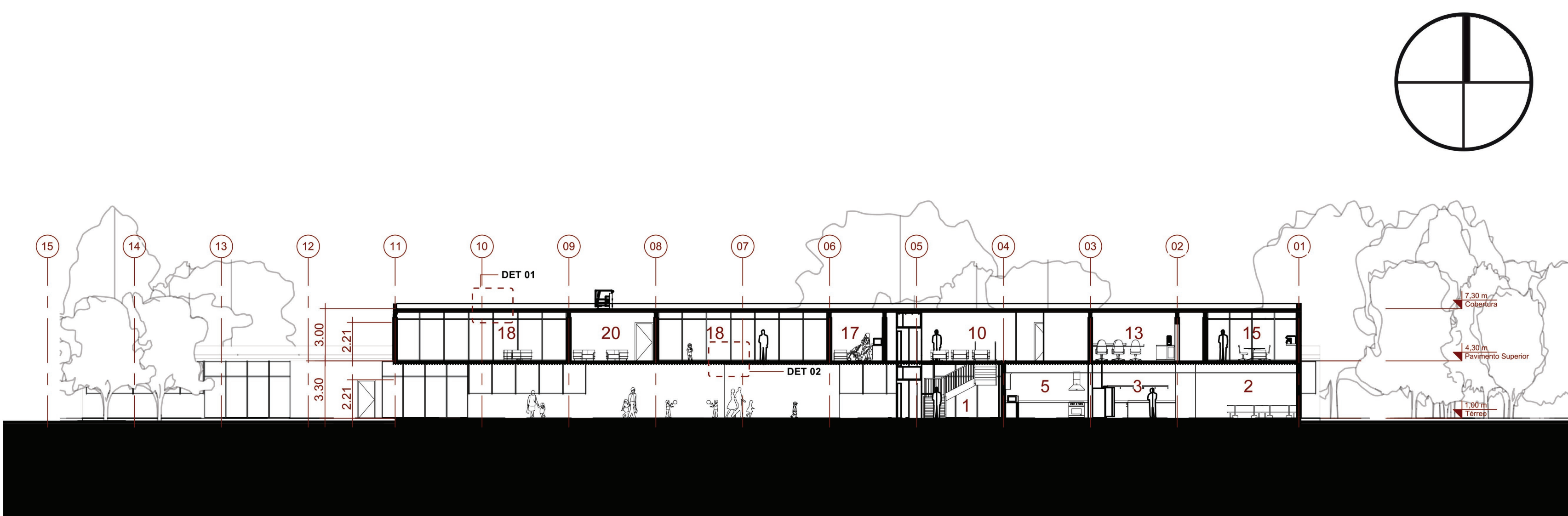
CORTE AA Escala 1:200