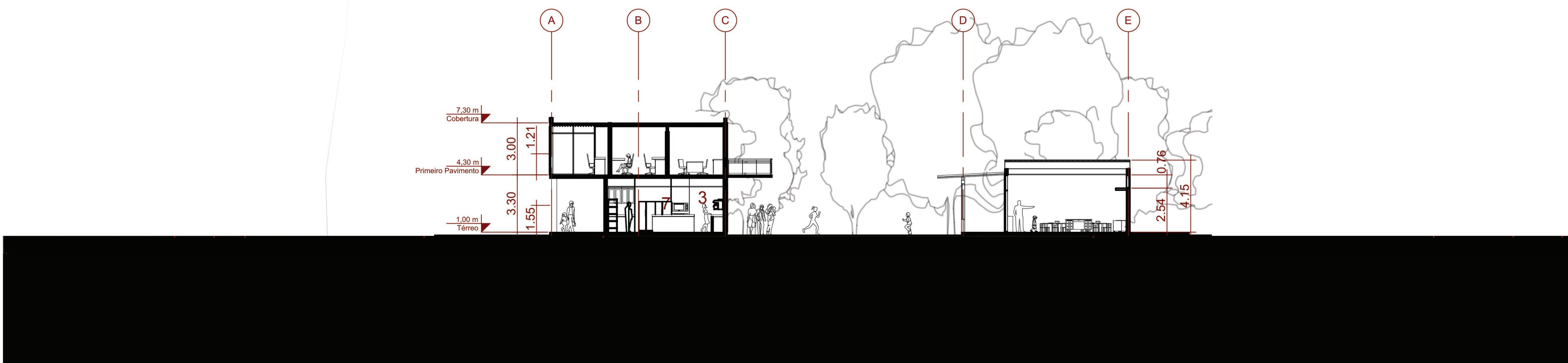
CORTE CC Escala 1:200