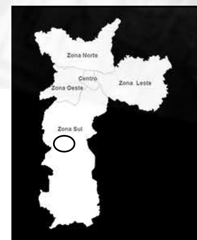
1- SITUAÇÃO MACROESPACIAL