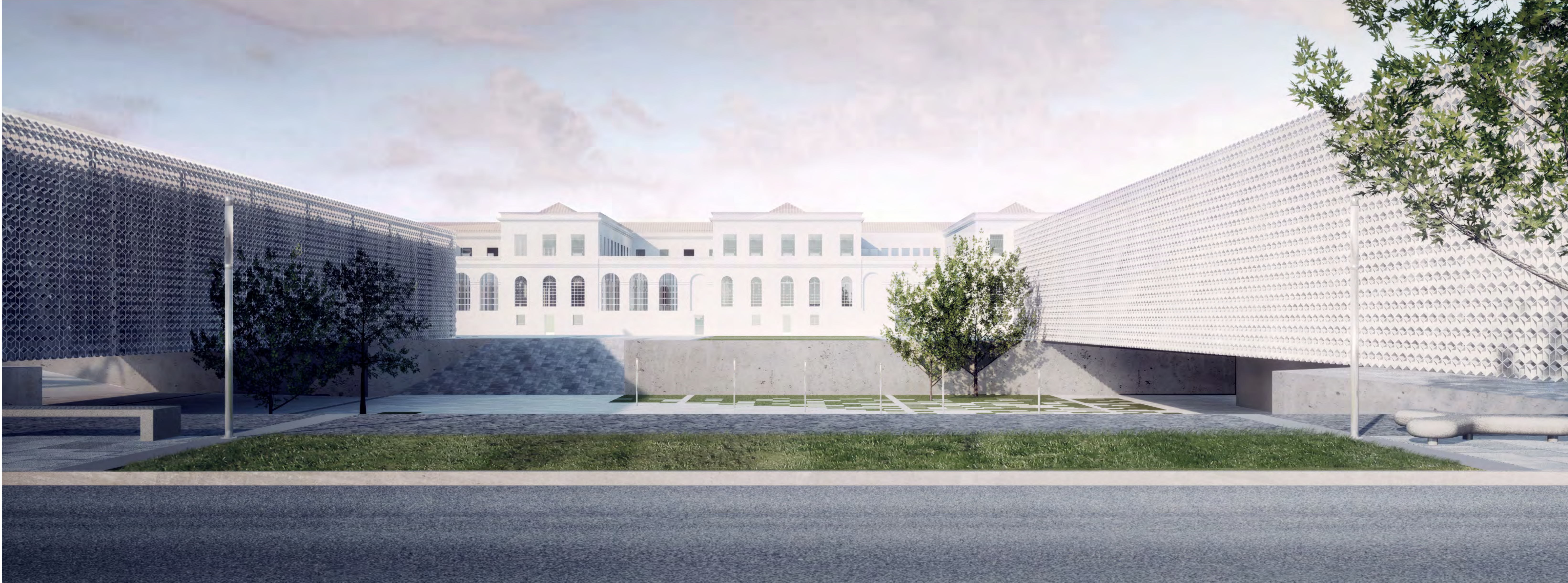
BRASIL - RIO GRANDE DO SUL - PORTO ALEGRE - PARTENON