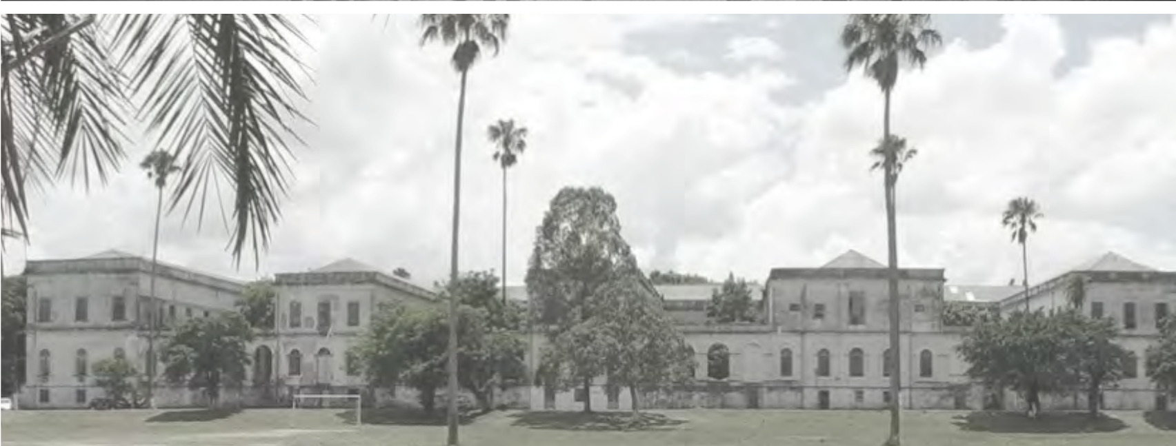
TERRENO - HOSPITAL PSIQUIÁTRICO SÃO PEDRO

O Hospital psiquiátrico Sao Pedro foi a primeira instituição psiquiátrica de Porto Alegre e foi o maior hospital psiquiátrico do sul do Brasil. O seu desuso ocorreu em função dos avanços nos medicamentos psico-farmacos que trouxeram uma maior estabilidade psíquica aos pacientes e assim, permitiu um que grande parte deles pudessem realizar o tratamento em suas casas e perto de suas famílias, não necessitando, muitas vezes, serem internados.