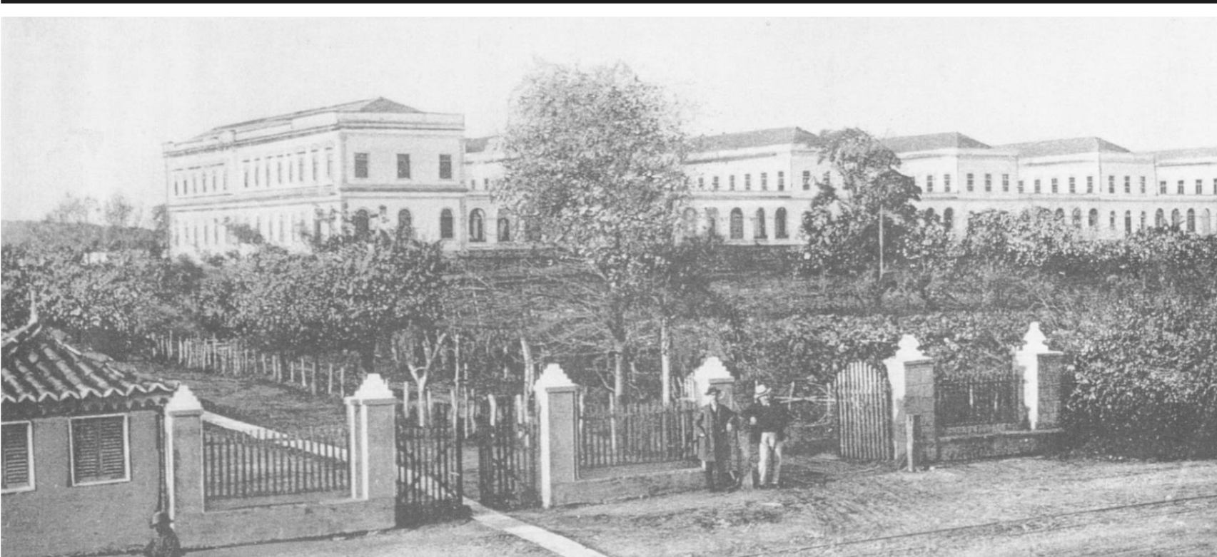
HOSPITAL PSIQUIÁTRICO SÃO PEDRO