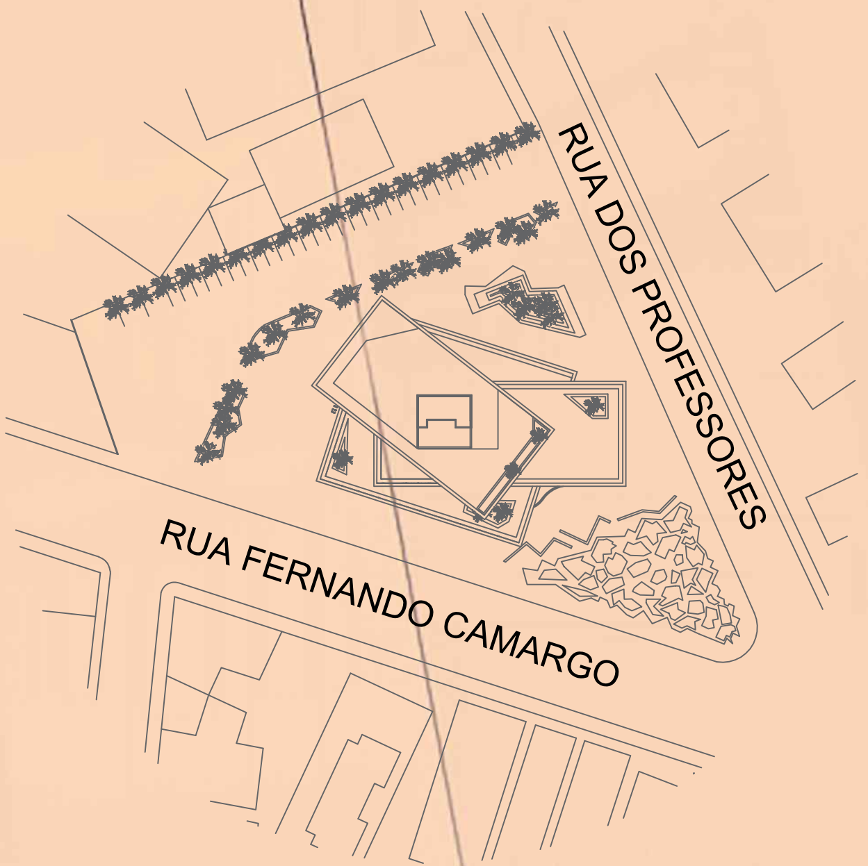
SITUAÇÃO ESC. 1:1000