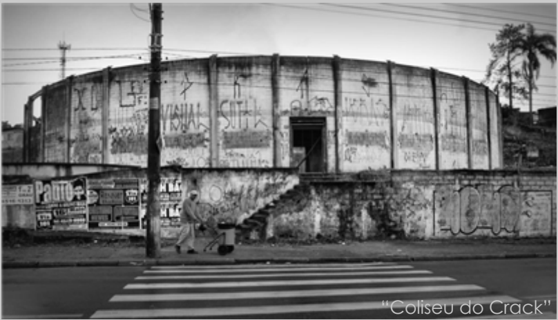
"Coliseu do Crack"

No terreno existe o antigo e abandonado Ginásio Poliesportivo Élio Bernardi conhecido como "Coliseu do Crack" devido a invasão de dependentes químicos e pelo formato que lembra o famoso monumento romano, o ginásio que