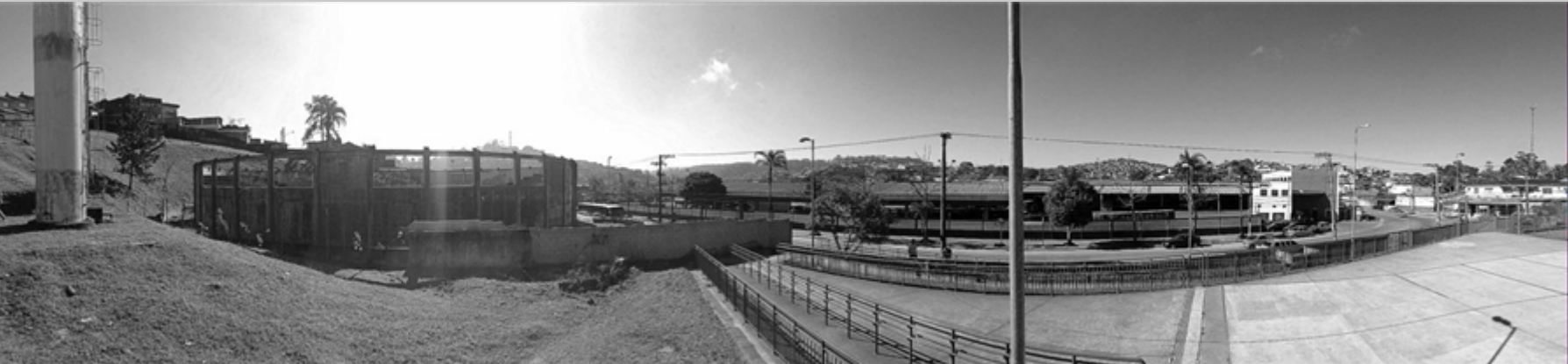
Vista da escola para a área

Portanto o terreno definido para o projeto, com área de 4,5 mil m², está localizado na Av. do Pilar Velho, Jardim Esperança, no município de Mauá na Grande São Paulo. A Secretaria Municipal de Cultura (SCEL) registra na região apenas dezesseis equipamentos públicos em atividade, dois campos, uma quadra poliesportiva, cinco ginásios poliesportivos, cinco bibliotecas, um museu e um teatro, que atendem a uma população de cerca de 448 mil pessoas do município.