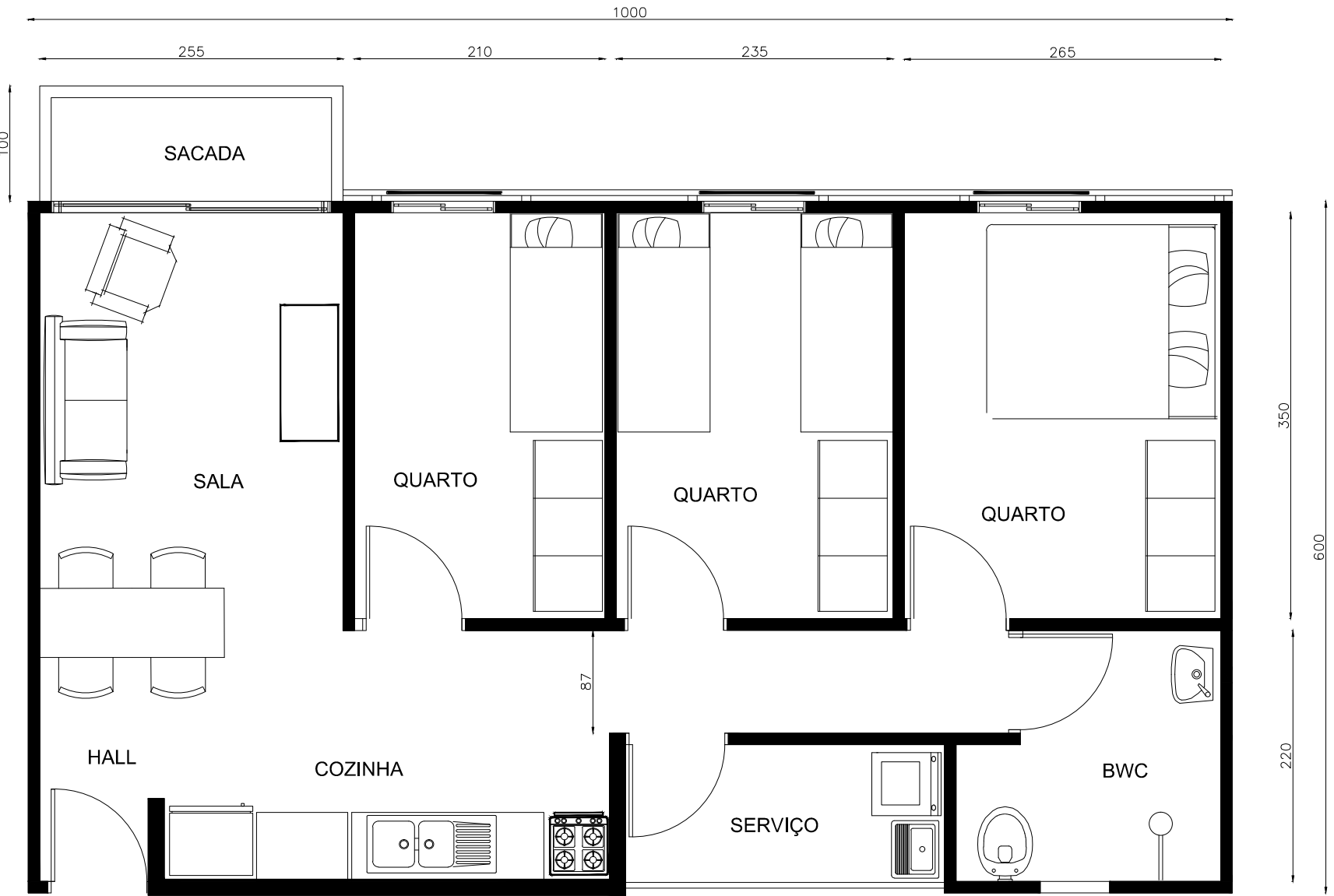
PLANTA UNIDADE 3 QUARTOS ESCALA 1:50