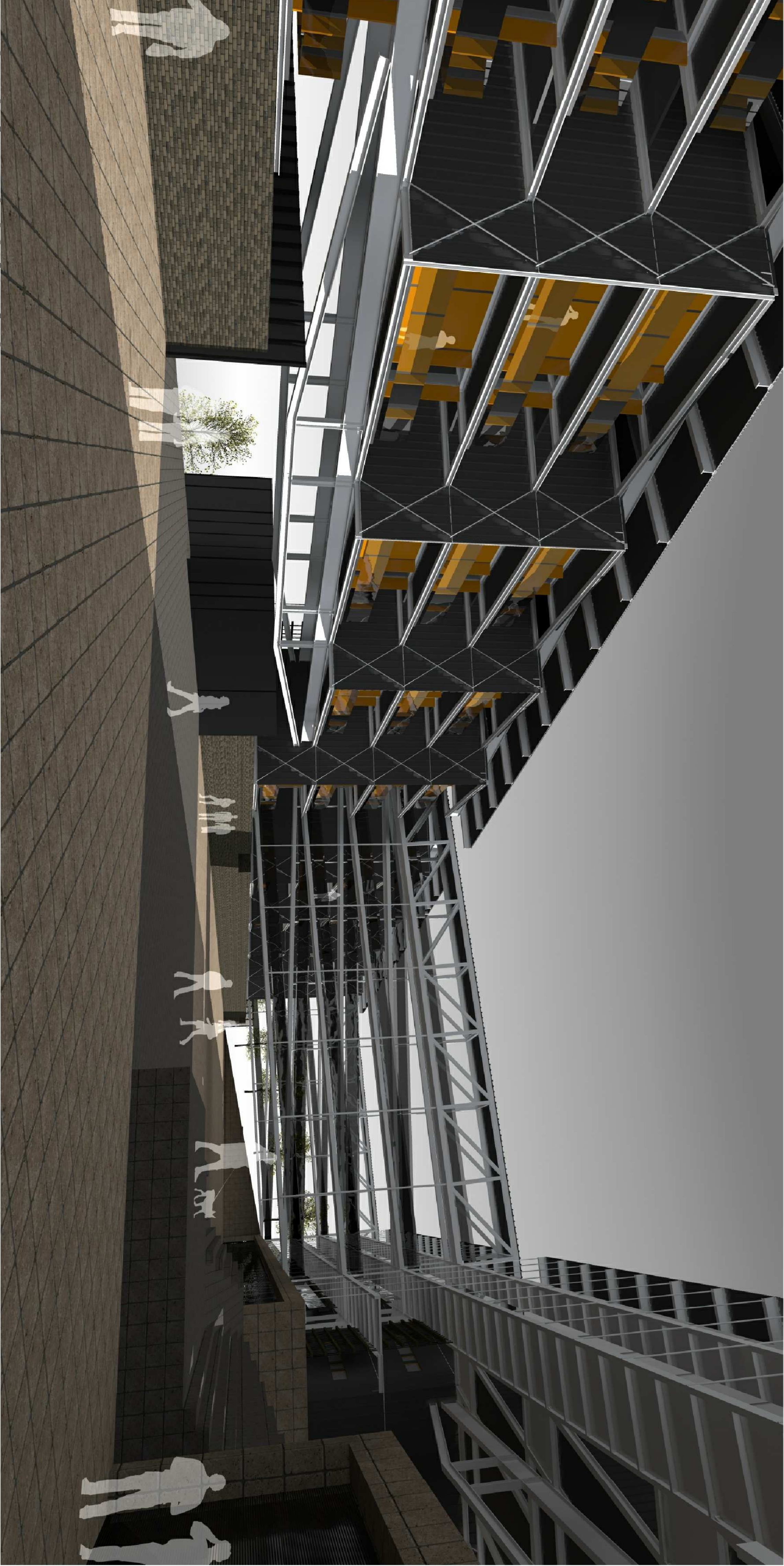
PERSPECTIVA DO CONJUNTO sem escala

O uso do aço permitiu a racionalização do processo de projeto e construção, simplificando os processos de fabricação, montagem e acabamento dos componentes, tornando os custos acessíveis. O desenvolvimento do projeto buscou uma estrutura modular que correspondesse com a melhor solução ao local, desta maneira a angulação das aberturas das unidades habitacionais garantiram melhor insolação sem prejuízo da modulação estrutural.