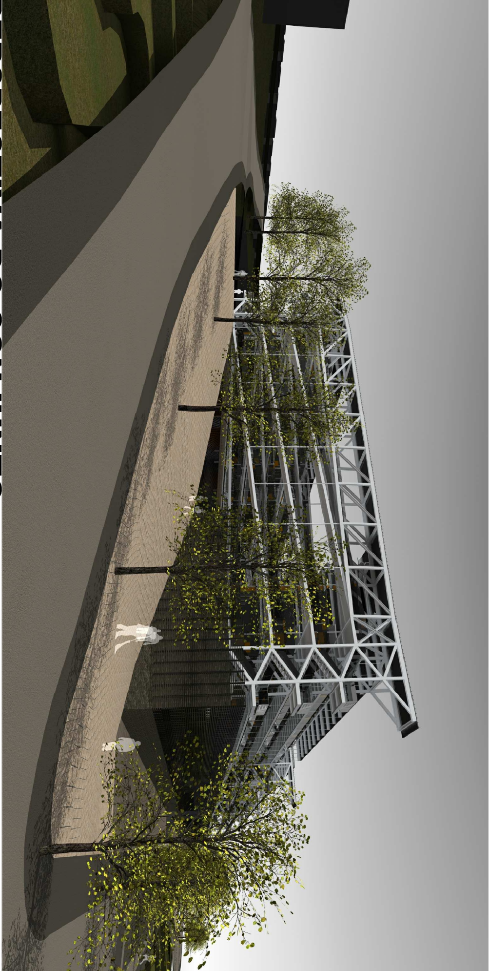
PERSPECTIVA DO CONJUNTO sem escala