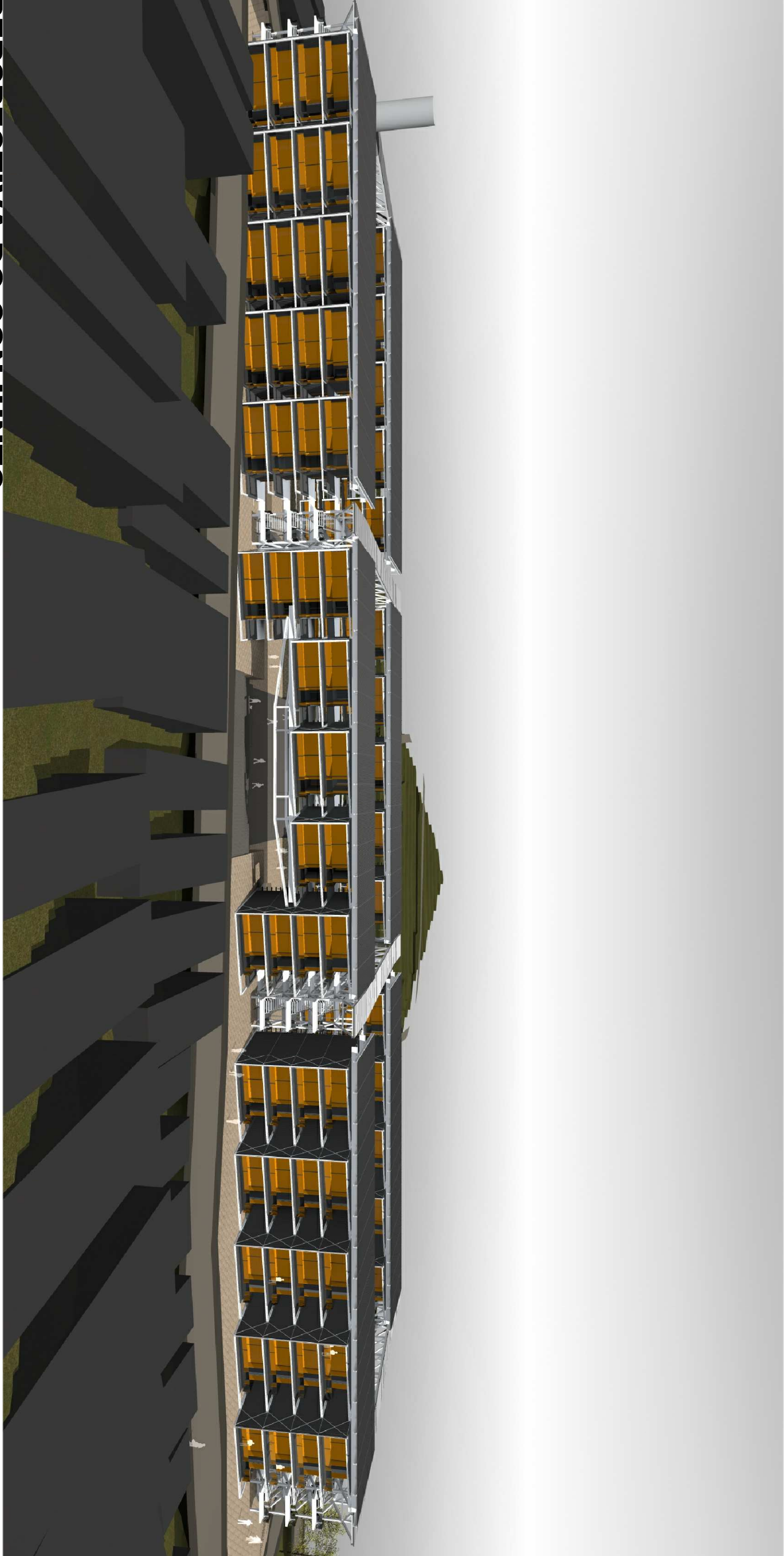
PERSPECTIVA DO CONJUNTO sem escala