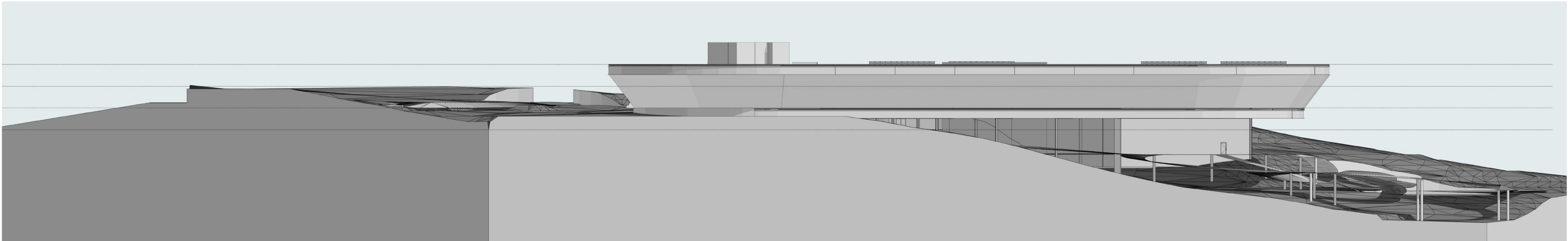
ELEVAÇÃO 3 Escala 1:250