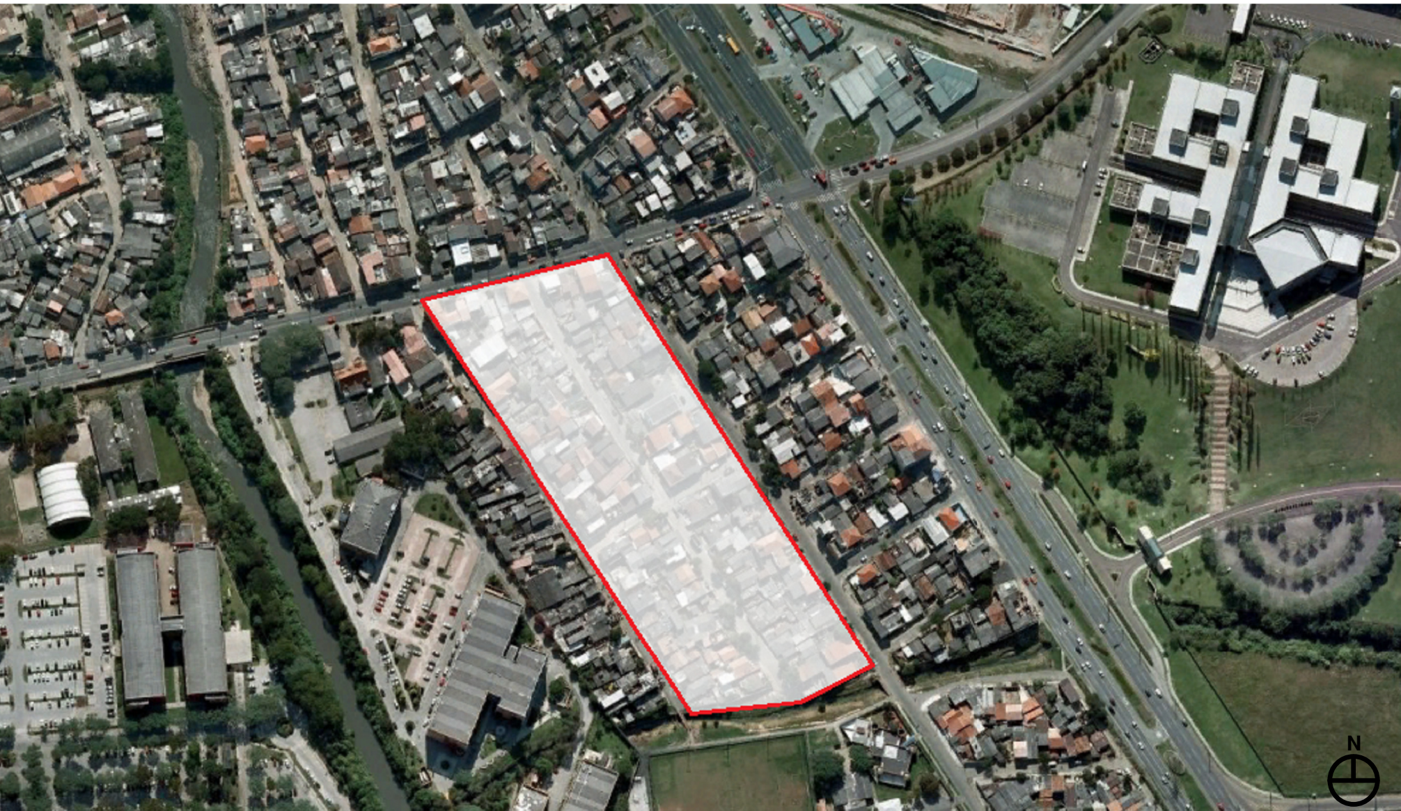
TERRENO - VILA TORRES, CURITIBA-PR