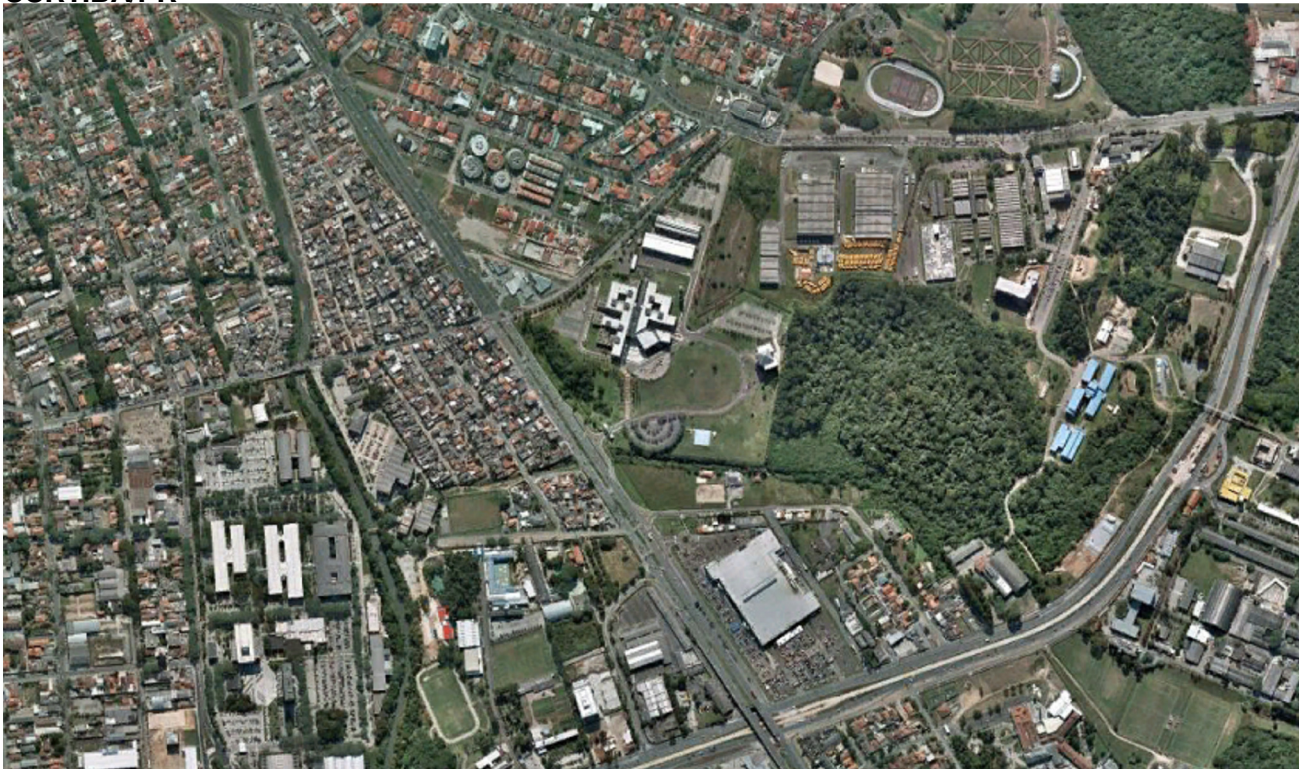
VILA TORRES - CURITIBA/PR